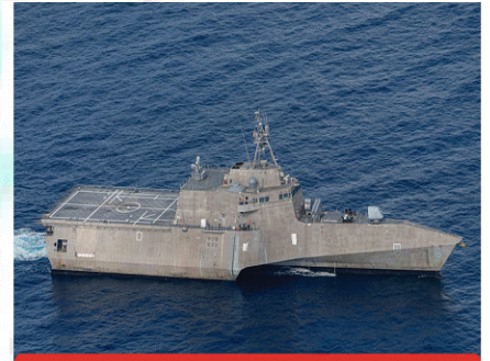
BANGLADESH-US JOINT NAVAL EXERCISE HELD IN CHATTOGRAM

(B) हाल ही में बांग्लादेश के चटोग्राम में वीएनएस निर्विक पर संयुक्त बांग्लादेश-अमेरिकी नौसेना अभ्यास टाइगर शार्क 40 का आयोजन किया गया। इस अभ्यास का उद्देश्य दोनों देशों की रणनीतिक क्षमताओं को बढ़ाने के साथ पारस्परिक तकनीकी ओर प्रक्रियात्मक ज्ञान प्राप्त करना है। यह अभ्यास दोनों देशों के सशस्त्र बलों के बीच संबंधों को बेहतर बनाने के लिये किया गया।